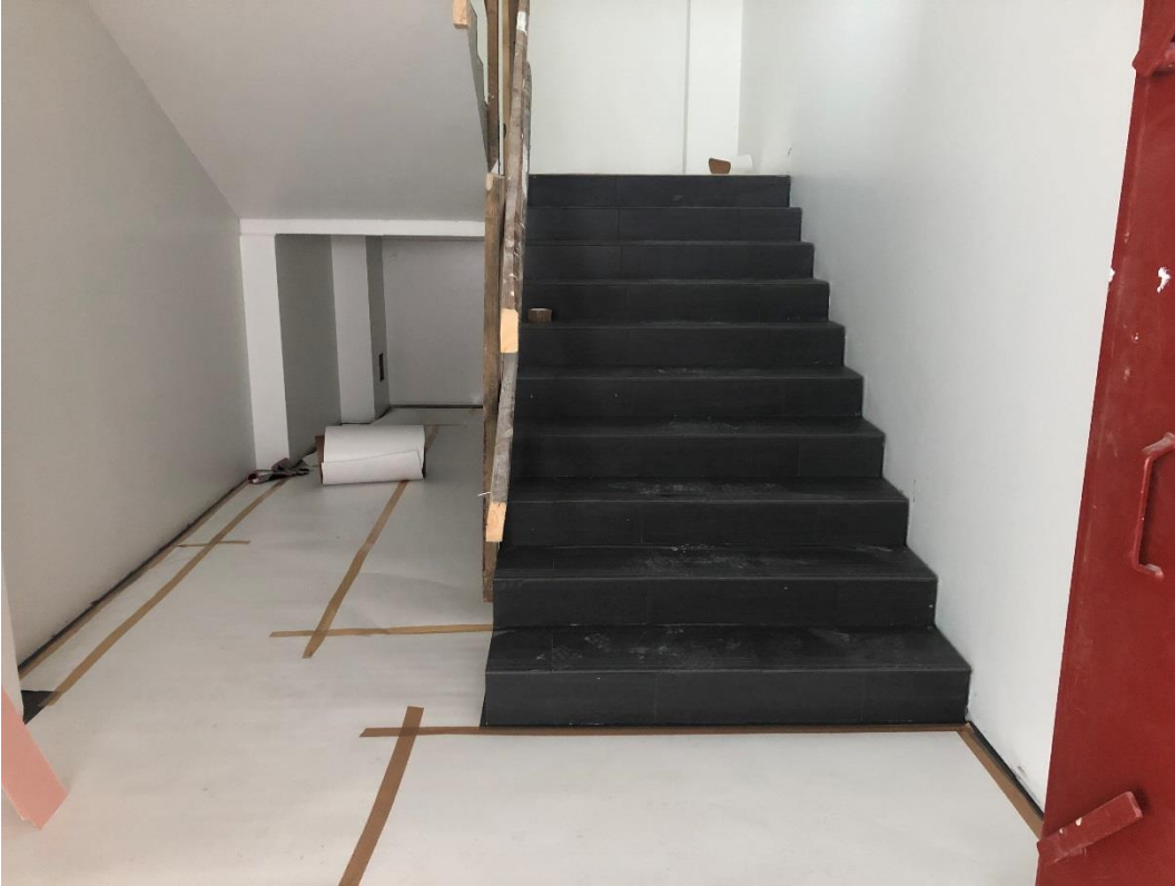
Porrashuoneen lattiat ja portaat laatoitettu. Suojataan portaat ja asennetaan seuraavaksi lasikaiteet.