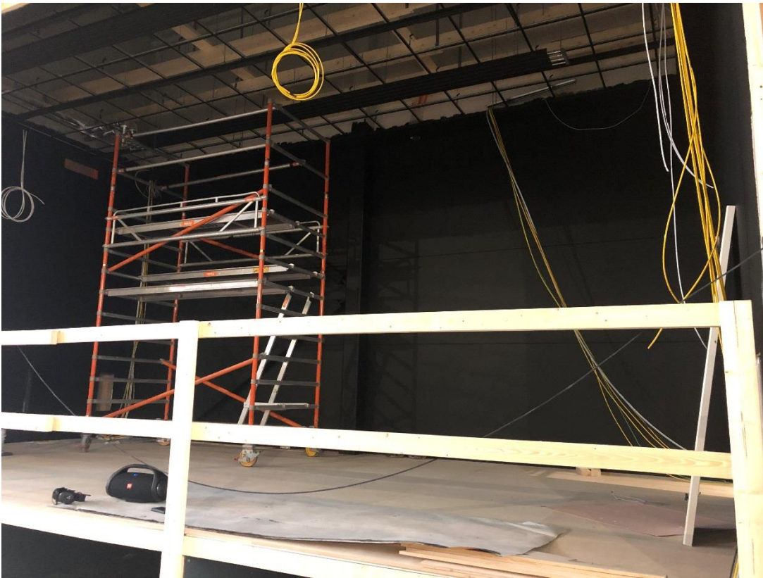
Näyttämön seinät maalattu mustaksi ja lattian korotus tehty. Parketti asennetaan myöhemmin.