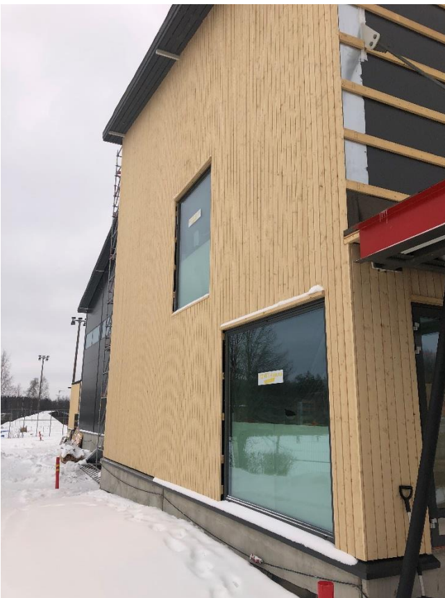
Julkisivun puuverhoilut aloitettu. Tässä kuultokäsiteltyä panelia.