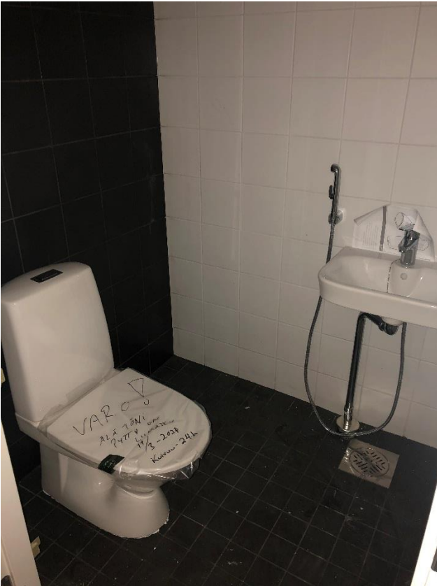
Lvi kalustus aloitettu vss tiloissa.