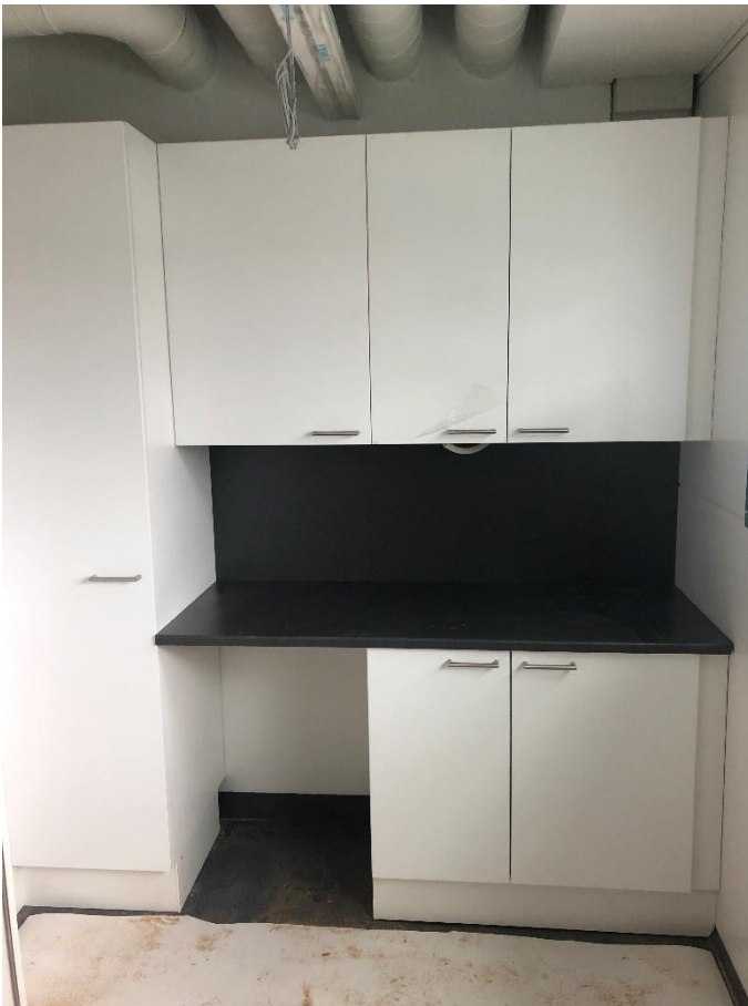
Kalusteasennukset valmistumassa 1. ja 2. krs.